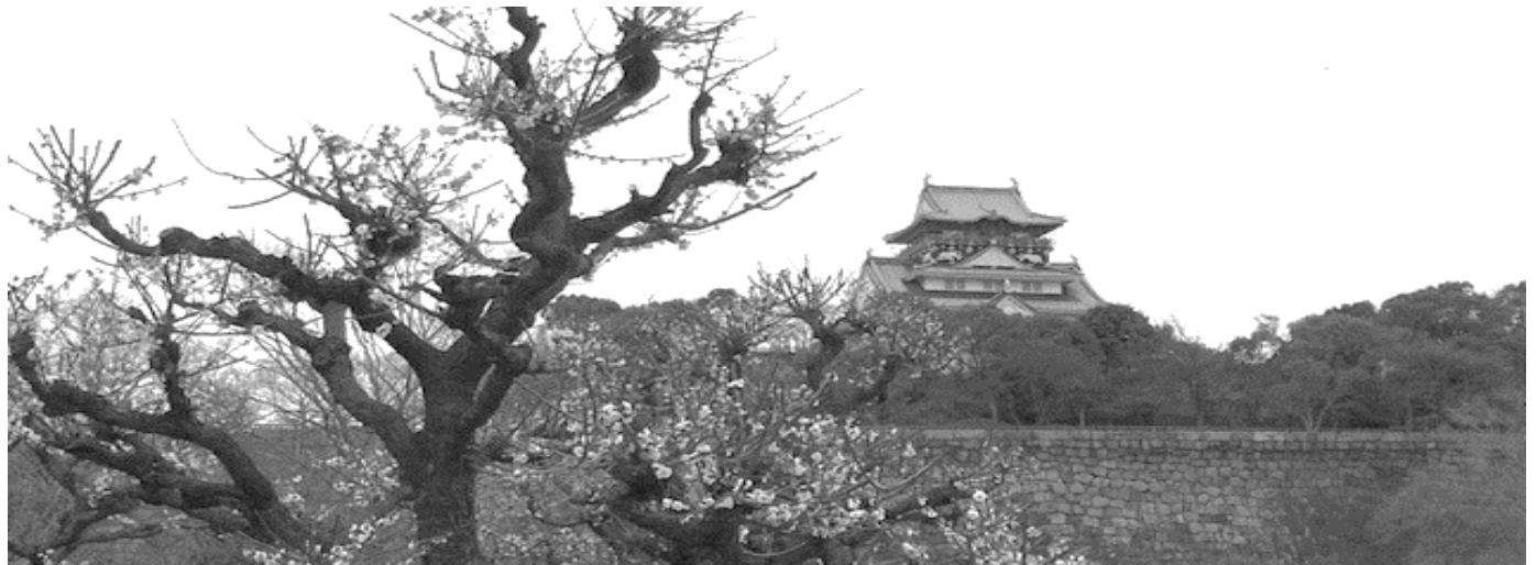
大阪城公園の梅園

梅、木蓮、木瓜、雪柳そして桜と続く花の季節に、豊かな春を愛でる幸せを日々感じています。皆さま、いかがお過ごしでしょうか。