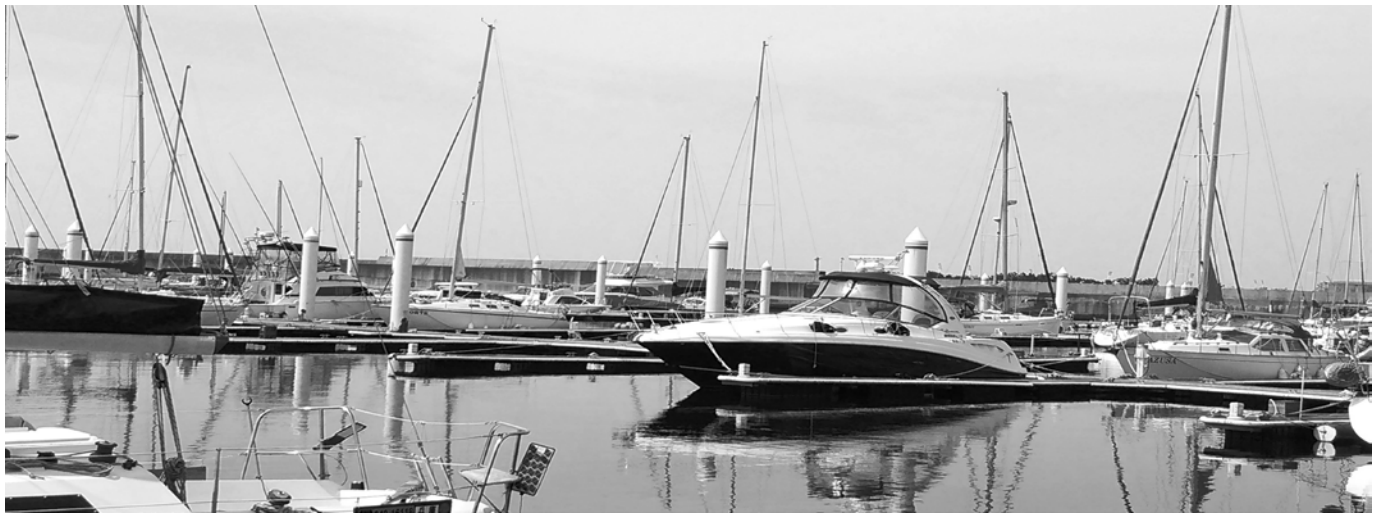
西宮のヨットハーバー