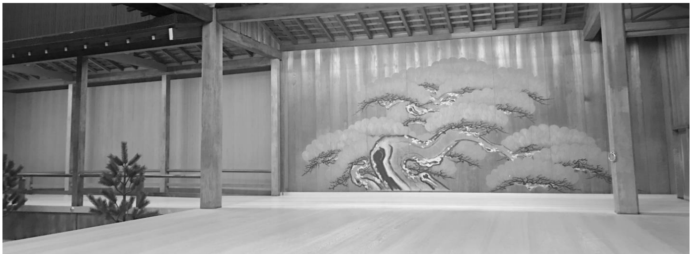
十四世喜多六平太記念能楽堂舞台