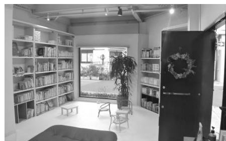
絵本・児童書コーナー

西天満小学校区はマンションが増え、若い世代の転入者が増えていますが、住民の半数近くが引っ越して5年未満の居住者ということです。近隣に知り合いのいない方も多く、まちライブラリー北勝堂では0歳の子どもの親の集いや絵本の読み聞かせを開催する等、まちに暮らす人が出会い、ゆるやかに繋がる場を目指し、活動されています。