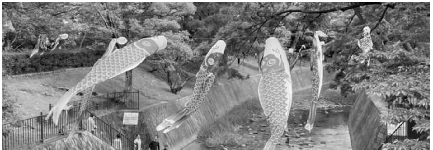
鯉のぼり 阪神香櫨園駅

三年ぶりの移動制限なしのゴールデンウィーク、 人々の、太陽や緑そしてグルメを満喫したいと思う気持ち、街に溢れていましたね。 皆さまは、いかがお過ごしでしたか。